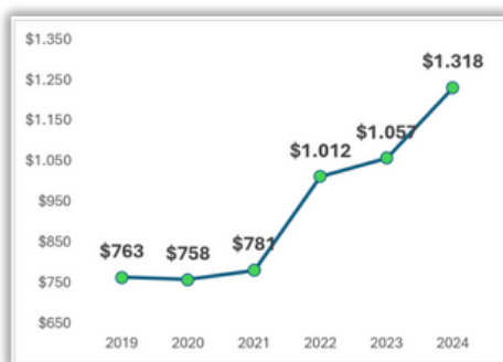
Ingresos por sostenimiento CCI Norte 2019-2024 Expresado en millones de pesos.