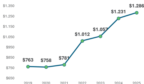
Ingresos por sostenimiento CCI Norte 2019-2025 Expresado en millones de pesos.